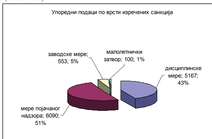
Графикон 3 – Упоредни подаци по врсти кривичних санкција за посматрани период (2004-2009)

- 100 казни малолетничког затвора (или 0,84% од укупног броја изречених кривичних санкција за посматрани период) старијим малолетницима. Највише казни малолетничког затвора је изречено 2007. године 30 (или 30,0% од укупног броја изречених казни малолетничког затвора у посматраном периоду). Најмањи број изречених казни малолетничког затвора је забележен 2005. године 7 (или 7,0%).