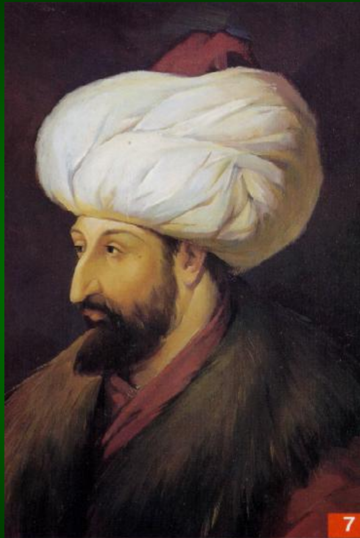
FATİH SULTAN MEHMED H. 855-886 M. 1451-1481 55x65 Tuval / Yağlı Boya