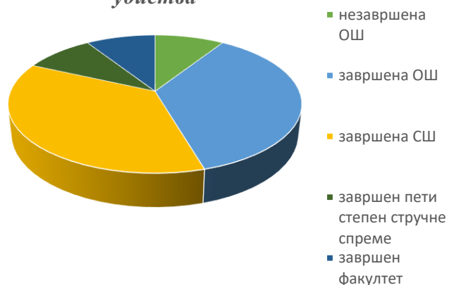
Графикон 2 - Степен образовања извршилаца убиства

О утицају следећих егзогених криминогених фактора на убице у нашем истраживању и то средстава масовних комуникација, суседства и делинквентних група нема података, али се на основу анализе њихових случајева може закључити да су петорица убица на неки начин били повезани са особама из делинквентних група.