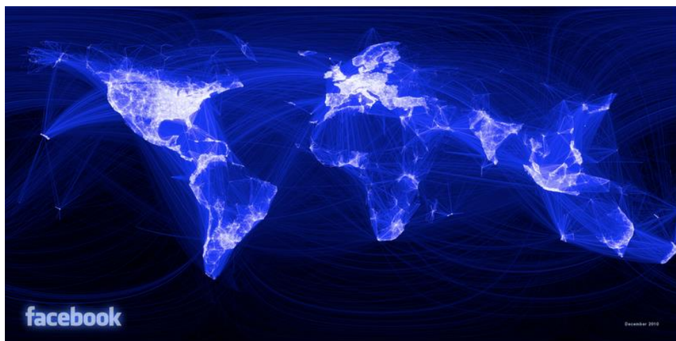
Слика 1. Комплексност веза данас

Као најпознатија слика у том подручју би наравно била слика веза на Facebook - у, која је и сама доказ комплексности веза у данашњем друштву.