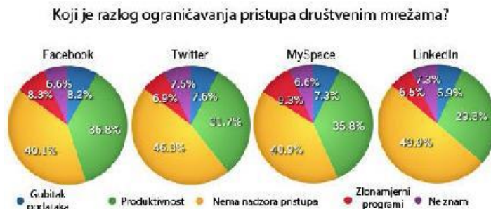
Слика 3. Приказ резултата истраживања спроведеног у компанијама 22

корисник временом толико навикне на виртуелни свет који друштвене мреже стварају и да се тотално отуђи од стварног света. Проблем код ове врсте комуникације је зависност од исте. Та зависност од друштвених мрежа се може третирати као компјутерска наркоманија .